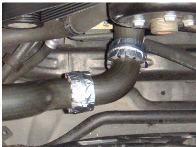
ロアホース(ラジエター入口)に2連装の装着例 (エンジン入口付近)

*ラジエターホースには入口側と出口側がありますが、どちらの配管でもかまいませんがロアホース(冷却出口側からエンジンへ)のエンジン近くの方が効果が出やすいようです。(ロアホースは普通、ラジエターの下部から出ておりますので、装着困難な場合があります。)